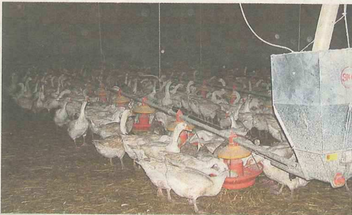
Das spezielle Tränken- und Futtersystem erlaubt den Tieren laufend Zugang zu Futter und Wasser.